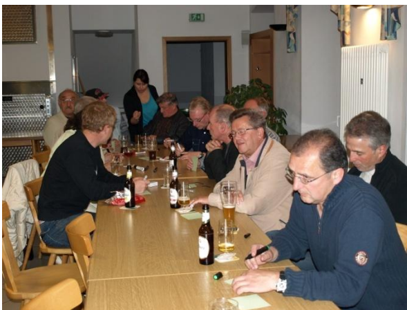
Bürgerinnen und Bürger von Berschweiler

Als inhaltlichen Einstieg in die Dorfmoderation wurde gemeinsam eine Stärken-Schwächen-Analyse mit allen Anwesenden durchgeführt, deren Ergebnisse nachfolgend dargestellt werden.