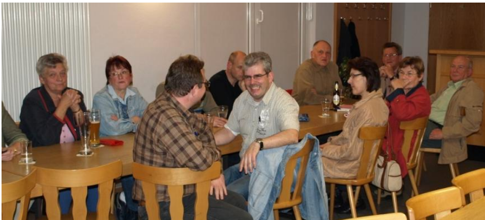
Interessierte Teilnehmer der Auftaktveranstaltung

In den Arbeitskreisen werden die Defizite der Gemeinde bzw. Ortsteile diskutiert, Lösungsideen entworfen und zu Projektansätzen weiterentwickelt. Die Arbeitskreise werden ihre Projektansätze und Maßnahmenvorschläge am Ende auf der Abschlussveranstaltung vorstellen und nochmal mit allen diskutieren.