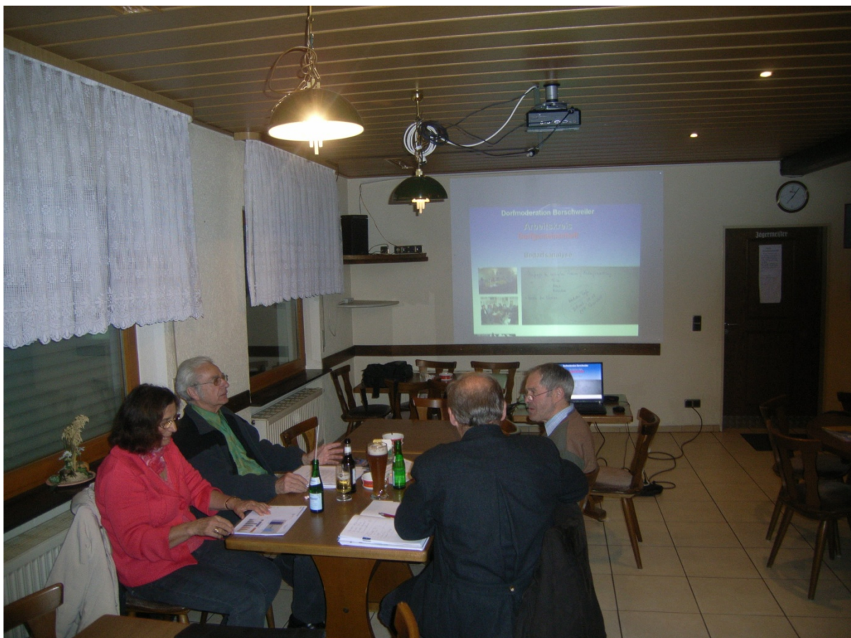
Die Ergebnisse der Bedarfsanalyse wurden ausgiebig besprochen

Im Rahmen der Dorfmoderation hat der Arbeitskreis „Dorfgemeinschaft, Miteinander“ eine Bedarfsanalyse im Zuge einer Haushaltsbefragung durchgeführt. Der Arbeitskreis hat sich mehrfach ohne Moderator getroffen, um die Befragung durchzuführen. Mittlerweile liegen die Ergebnisse der Bedarfsanalyse vor.